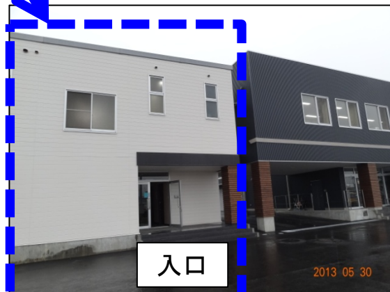
厚生棟 = 左側の白い建屋