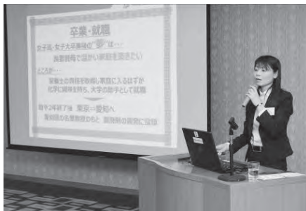
〈アドバイザー講演〉