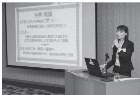
〈アドバイザー講演〉