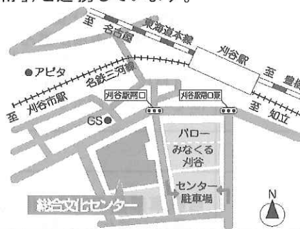
JR 東海道線・名鉄三河線 刈谷駅徒歩2分